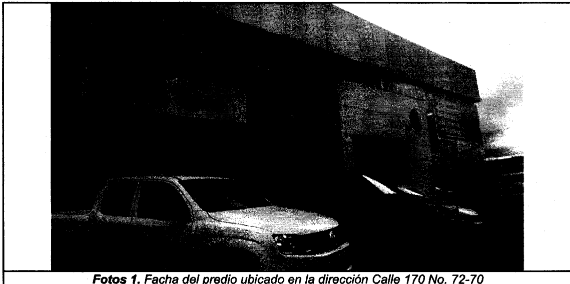
Fotos 1. Fachada del predio ubicado en la dirección Calle 170 No. 72-70

Se realizó visita técnica de control y vigilancia el día 30 de enero de 2017, al predio ubicado en la nomenclatura urbana Calle 170 No. 72-70, evidenciando que en la actualidad en el predio objeto de control funciona el establecimiento CASA TORO AUTOMOTRIZ S.A, tal como se muestra en el registro fotográfico.